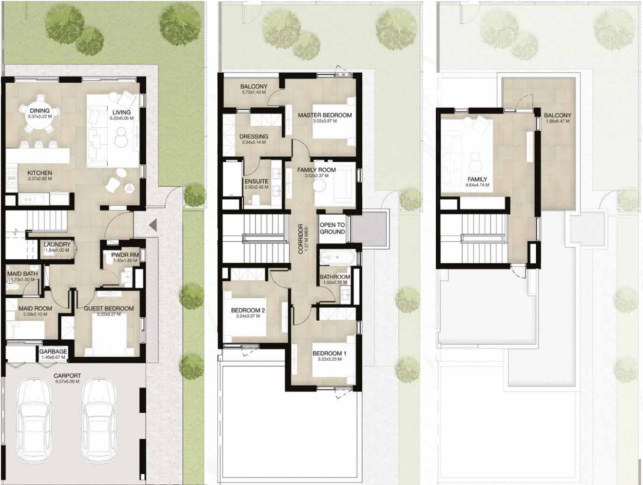
GROUND LEVEL الطابق الأرضي FIRST LEVEL الطابق الأول ROOF LEVEL السطح

المساحة الكلية: 276.70 متر مربع / 2,978 قدم مربع