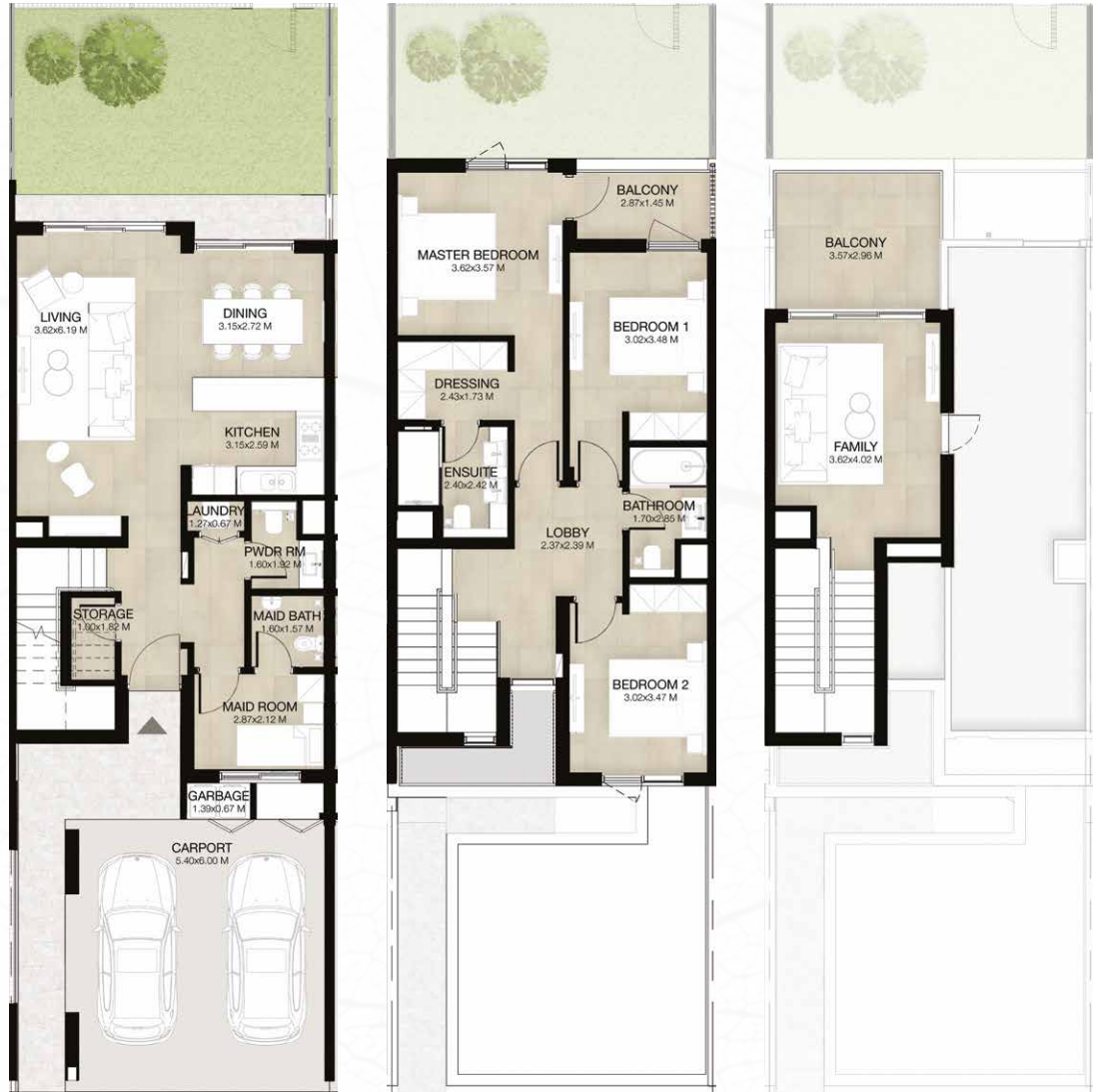
GROUND LEVEL الطابق الأرضي FIRST LEVEL الطابق الأول ROOF LEVEL السطح

3غرف نوم + غرفة عائلية و غرفة خادمة - الوحدة المتوسطة