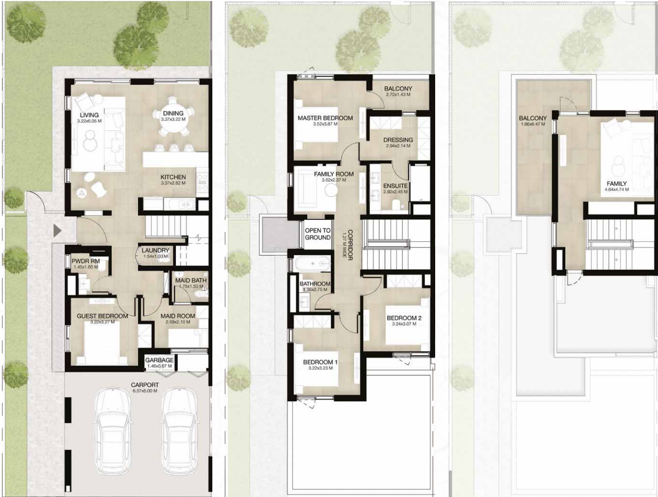
GROUND LEVEL الطابق الأرضي FIRST LEVEL الطابق الأول ROOF LEVEL السطح

المساحة الكلية: 276.70 متر مربع / 2,978 قدم مربع